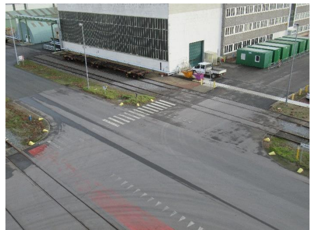
Stoom naar werkplaats en magazijn

Door de technische kennis van onze expert kan hij ook erg zelfstandig tewerk gaan in deze projecten. Ook de communicatie tussen onze expert en de Evonik collega's verloopt heel vlot. Zij functioneren als 1 team om de lopende zaken en projecten op te volgen.